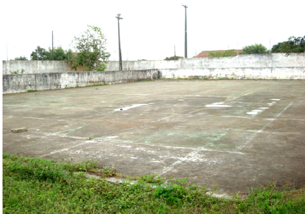
Imagem 03: Quadra poliesportiva

Quanto às atividades realizadas, a entrevistada relata os seguintes fatos: